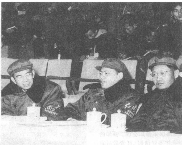
姚文元(中)与关锋(左)、戚本禹(右)在红卫兵集会上。

这件事,徐景贤也曾谈到。徐景贤说,1966年12月27日姚文元给他打电话说:“昨天晚上我们中央文革的几个人都到毛主席那里去了,祝贺主席生日,给主席敬酒。……主席和我们碰杯的时候说:祝全国全面内战开始!这一期《红旗》杂志将要根据主席的指示发表元旦社论,你们要很好地思考一下这个问题。”徐景贤问姚文元:“毛主席的指示我们可不可以在市委机关革命造反联络站的范围内传达?”姚文元说:“不要开大会,你们先在小范围里吹吹风吧!”接着,徐景贤在上海市委机关革命造反联络站骨干会议上传达了这一指示,并提醒与会者思考:“毛主席说的全国全面内战开始了,究竟有什么样的深刻含义?我们应该怎么做?”